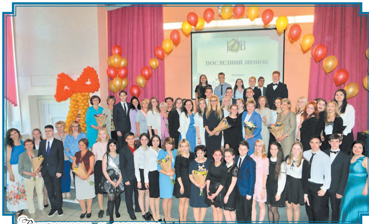
Выпускники и педагоги гимназии № 192