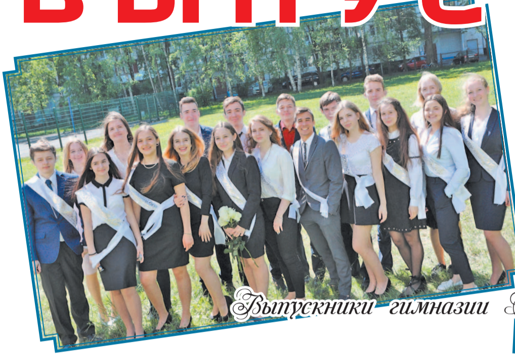
Выпускники гимназии № 192