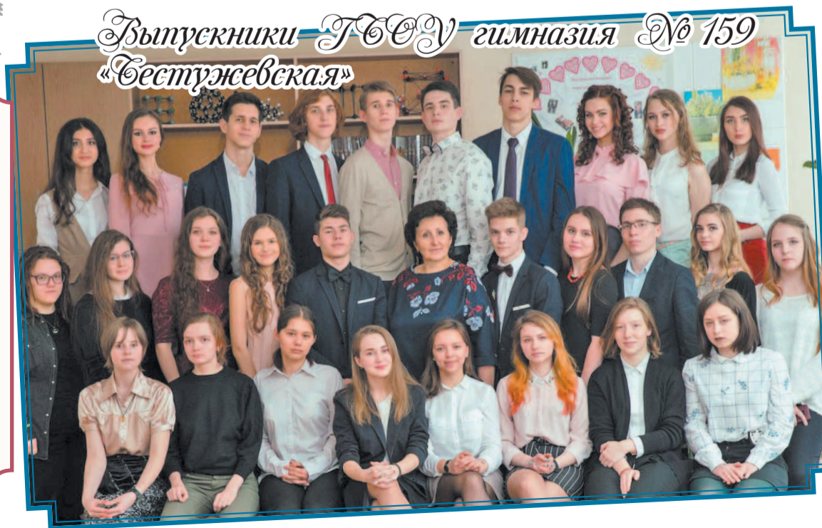
Выпускники ТСОУ гимназия № 159 «Бестужевская»

Помните, что мы всегда будем радоваться вашим успехам и поддерживать в трудную минуту, ведь вы наши дети. Не забывайте школу! Люблю вас! Буду скучать!