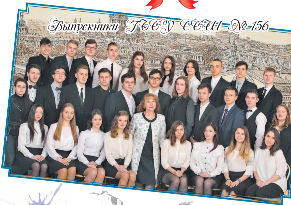
Выпускники ТСОУ СОУ № 156