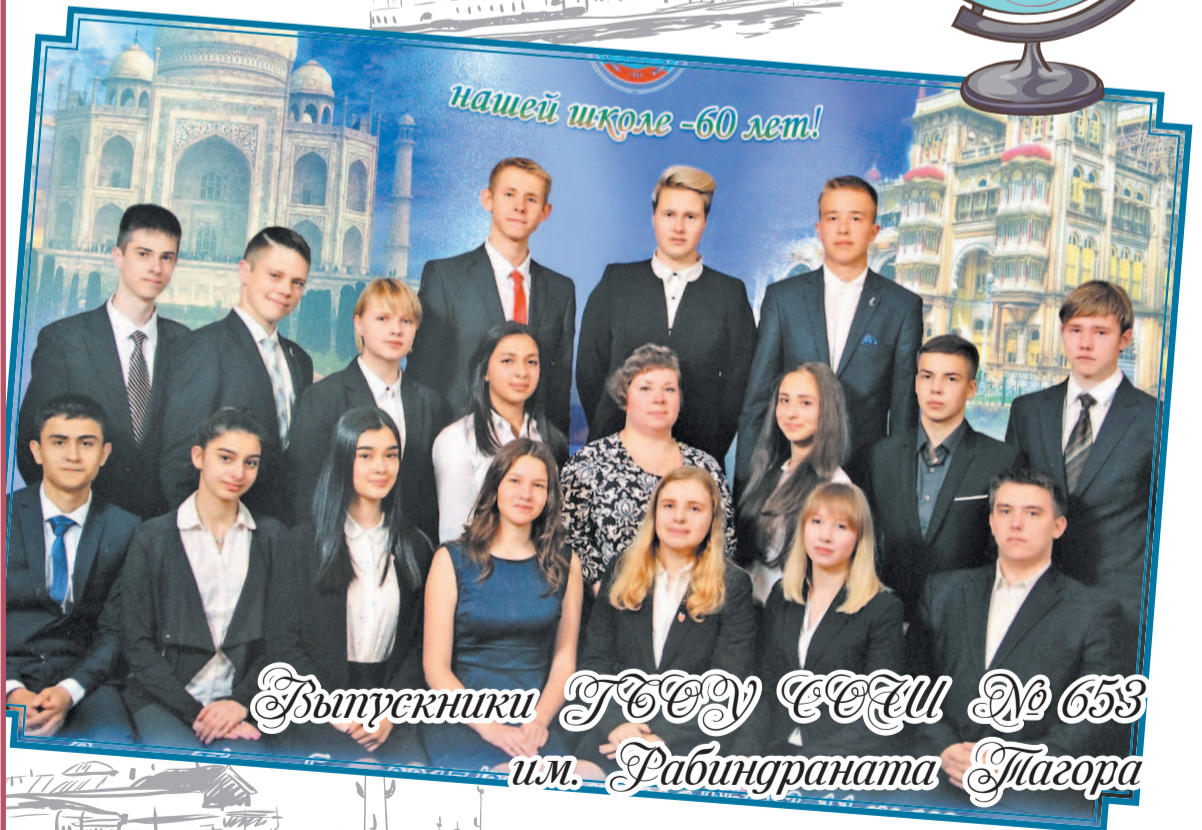
Выпускники ГБОУ СОШ № 653 им. Рабиндраната Тагора